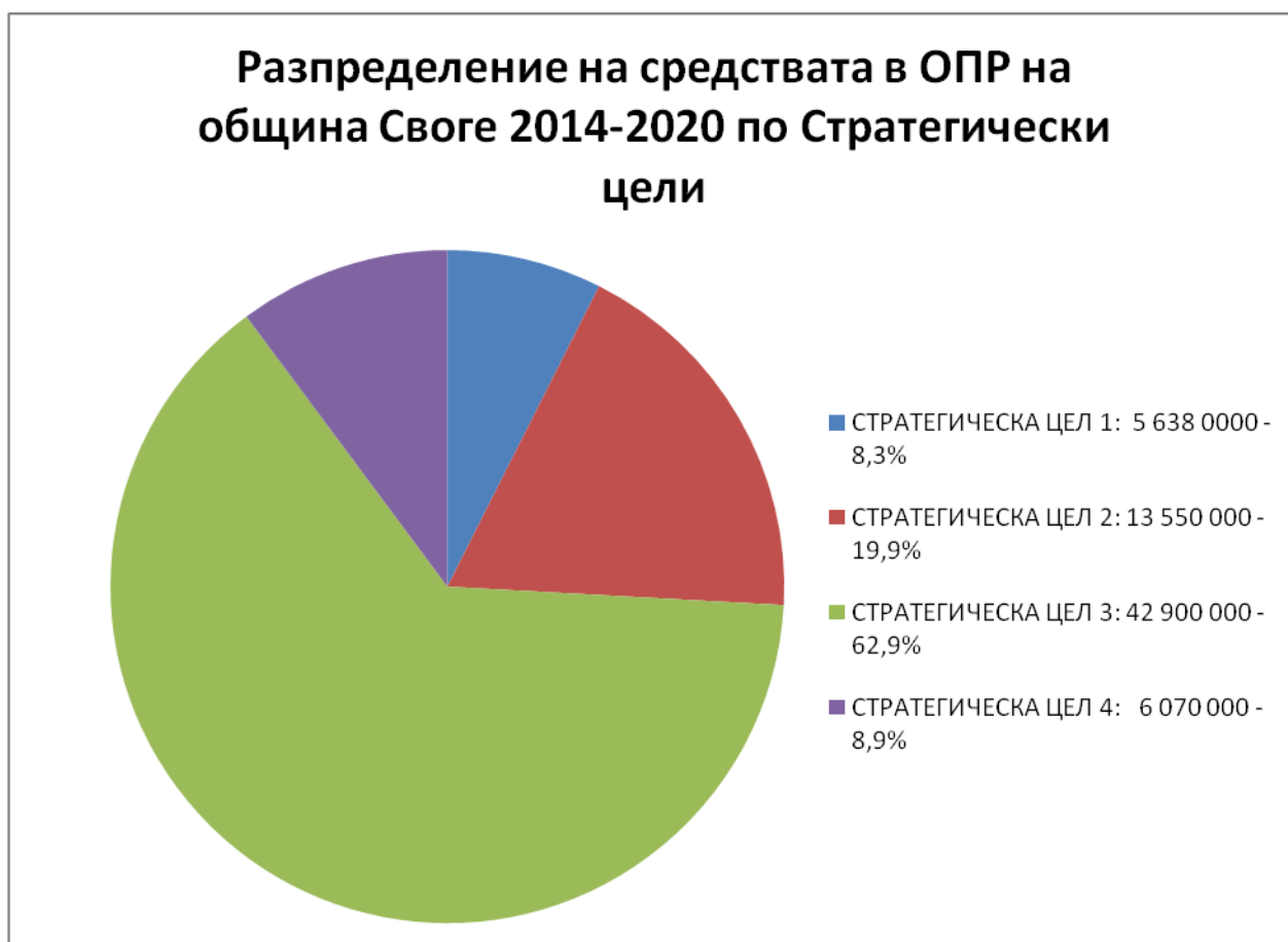
Фиг.4. Разпределение на средствата в ОПР на община Своге 2014-2020 по Стратегически цели